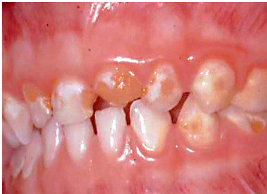
Abbildung 2: Nuckelflaschen-Karies an den Frontzähnen [26].

Die Beikost kann selbst gekocht oder gekauft werden. Bei selbst hergestellter Nahrung können die Eltern die Zutaten selbst auswählen und auf die Verwendung von Salz und Zucker verzichten. Außerdem wird eine hohe Variationsbreite bei Geschmack und Textur erreicht. Studien haben ergeben, dass dies die Akzeptanz für bisher dem Kind nicht bekannte Lebensmittel erhöhen kann [22]. Industriell gefertigte Nahrung hat den Vorteil, dass sie hohe gesetzliche Anforderungen erfüllen muss und dass sie wenig zeit- und arbeitsintensiv zubereitet werden kann. Bei Fertigprodukten sollten Produkte bevorzugt werden, die sich an Rezepten von selbstzubereiteten Speisen orientieren. Stark gesalzene, gewürzte oder gesüßte Produkte sollten nicht verabreicht werden. Vermieden